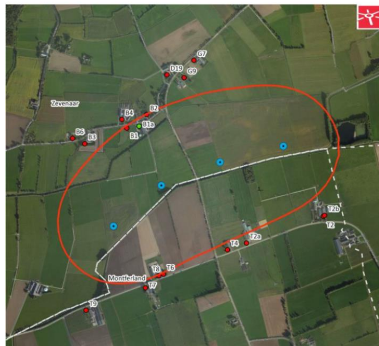
Afb.2 uit akoestisch rapport

Ten tweede Onze saamhorige, gezellige buurt is kapot gemaakt door de plannen van Raedthuys om windpark Bijvanck te bouwen. De grondbezitters (van windturbines en toegangswegen) krijgen een hele hoge jaarlijkse vergoeding, terwijl de omwonende de lasten hebben en hier niet voor gecompenseerd worden. Wel bestaat er een participatieplan, om zo draagvlak te creëren. Dit plan compenseert de schade totaal niet.